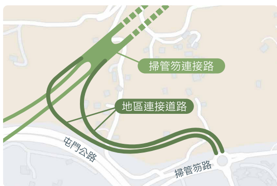
僅供參考的模擬效果圖

建議加建一條地區連接道路接駁至掃管笏路，讓當區居民無需經青山公路或屯門公路（小欖段），更直接使用十一號幹線前往市區。